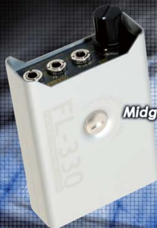
Midgrade Model FL-330