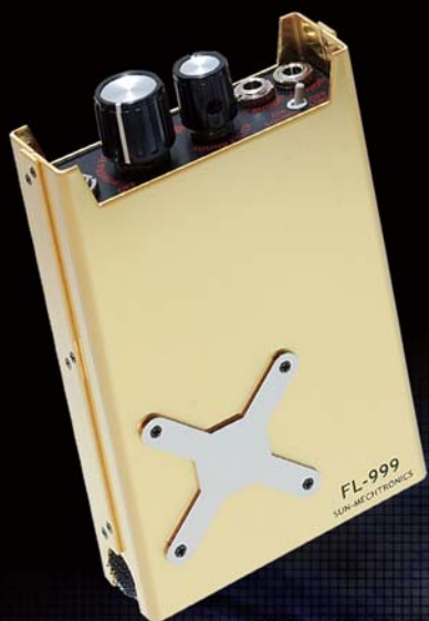
Flagship Model FL-999