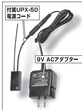
写真4 ACアダプターとの組合せ