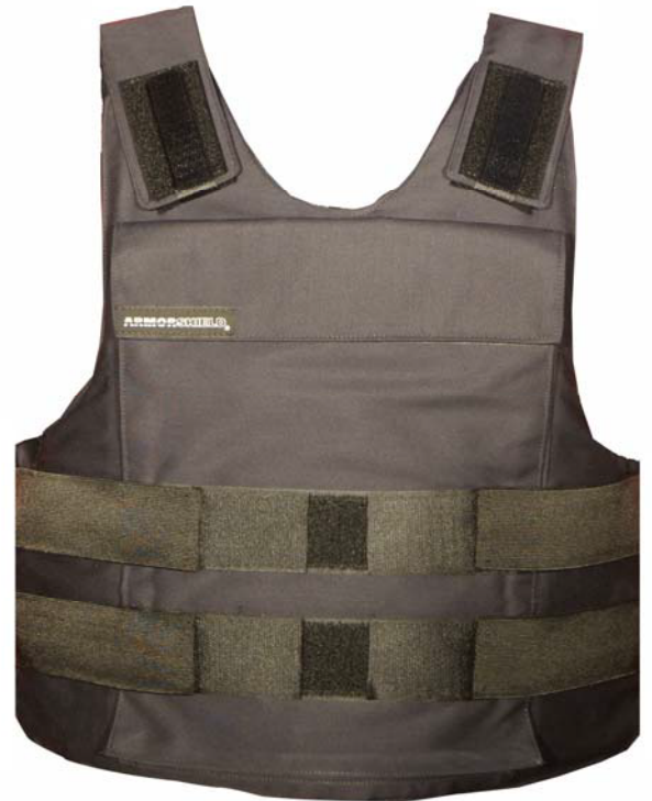
SCO-SMT001 SCO IIIA ボディアーマー MADE IN UK

※1 フルメタルジャケット ※2 ジャケテッドソフトポイント ※3 セミジャケテッドホローポイント