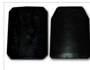
セラミックプレート