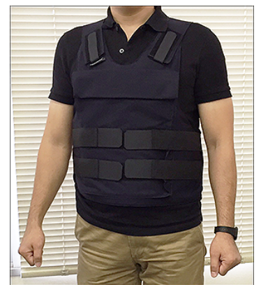
身長170cm, 72kg Lサイズ着用